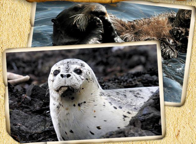
Рисунки: А. Мосалов, Т. Филиппова